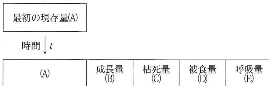
図2 物質生産の量的関係

(文4) 生態系において, 植物などの生産者は, 太陽の光エネルギーを取り込み, 光合成によって無機物である二酸化炭素と水から有機物を生産している。 (1) これを物質生産という。ある時点で一定面積内に存在する生物量を現存量という。図2は, 生産者について, 上段に示した最初の現存量(A)であったものが, t 時間後に下段のような成長量, 枯死量, 被食量, 呼吸量を加えた量となることを示した図である。これらの量は, 重量やエネルギー量で表される。